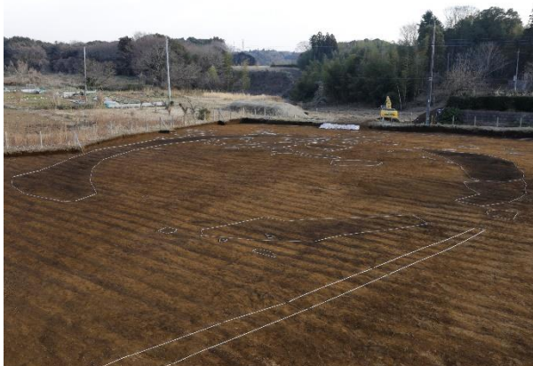
地中に埋もれていた古墳(黒色土部分が周溝)