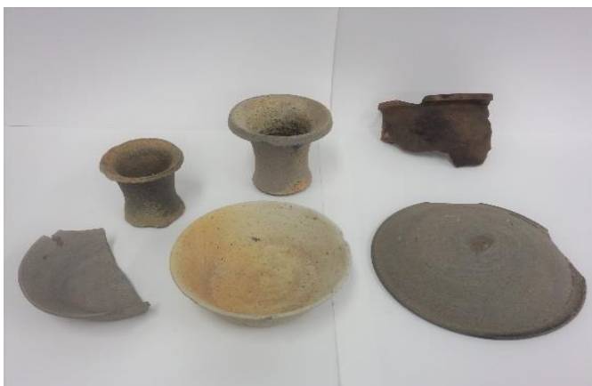
寺内遺跡から出土した土器