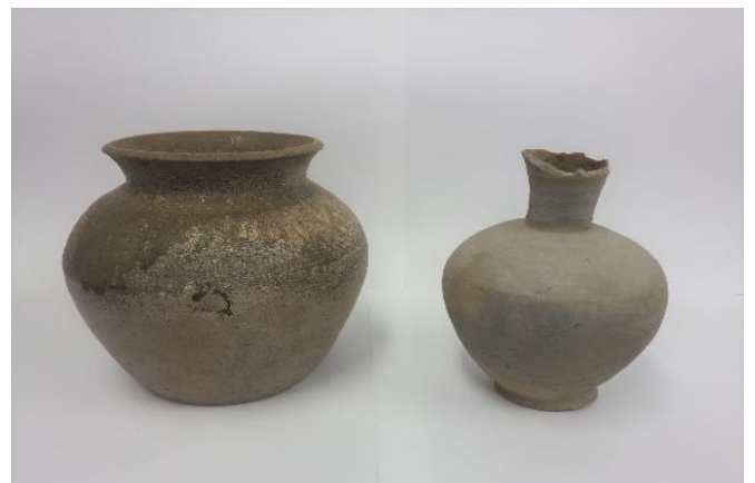
舟塚古墳群から出土した蔵骨器