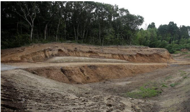
阿波寄合窯跡の全景