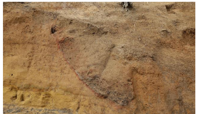
断面に現れた窯跡

現地説明会では，一緒に調査を進めている西久保遺跡の遺構や出土品と合わせて，担当者が分かりやすく解説します。ぜひお越しいただき，ご覧ください。