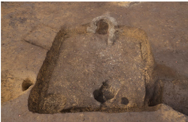
平安時代の竪穴建物跡